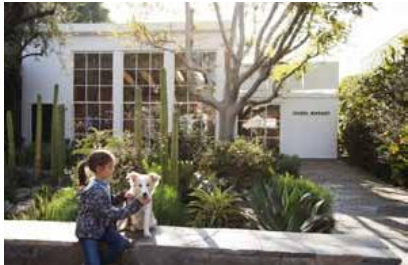
แอลเอเป็นแหล่งรวม บุคิกของดีไซเนอร์ ติวรุ่งทลายทั้น รวมถึง Isabel Marant ด้วย